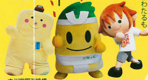
本州四国連絡橋シンボルキャラクター わたる